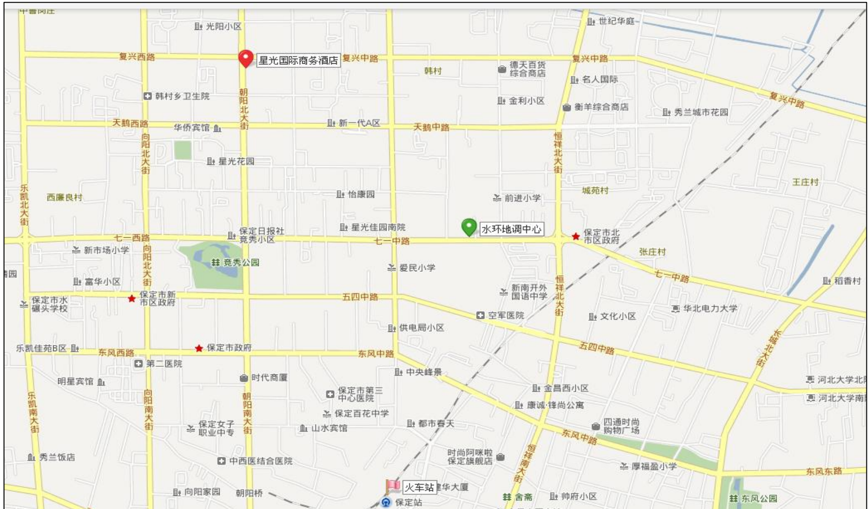
河北省保定市星光国际商务酒店和水环地调中心位置示意图